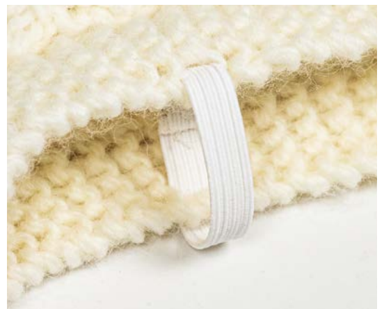
Kuva: Kuminauhan kiinnitys