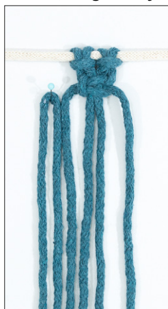
Kuva 4, langanlisäys