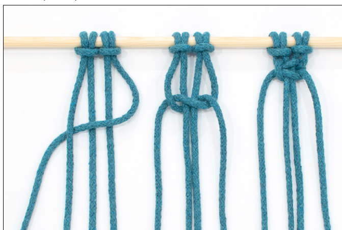
Kuva 2, KTS, vaihe 2