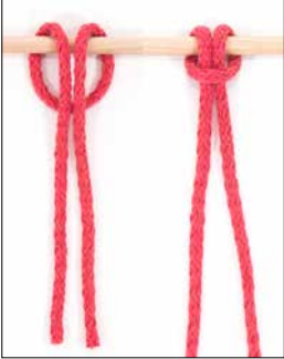
Kuva 1 Surmansilmukka