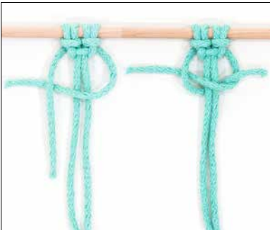
Kuva 3 Kaksoistasosolmu = KTS, 2. vaihe