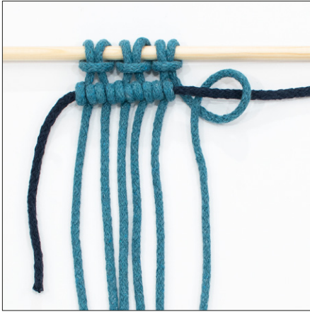
Kohosolmu = KS (kuva 1)